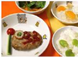
こいのぼりミートローフ