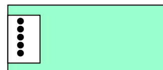
名前を大きく記入（おもて）

※ティッシュ×1箱 ・ビニール袋×1束 ・雑巾×1枚 ・タオル×1枚 ティッシュペーパー・ビニール袋などは入園時と不足した時に家庭連絡でお知らせをし、集めさせていただく場合がありますので、ご協力をお願いします。